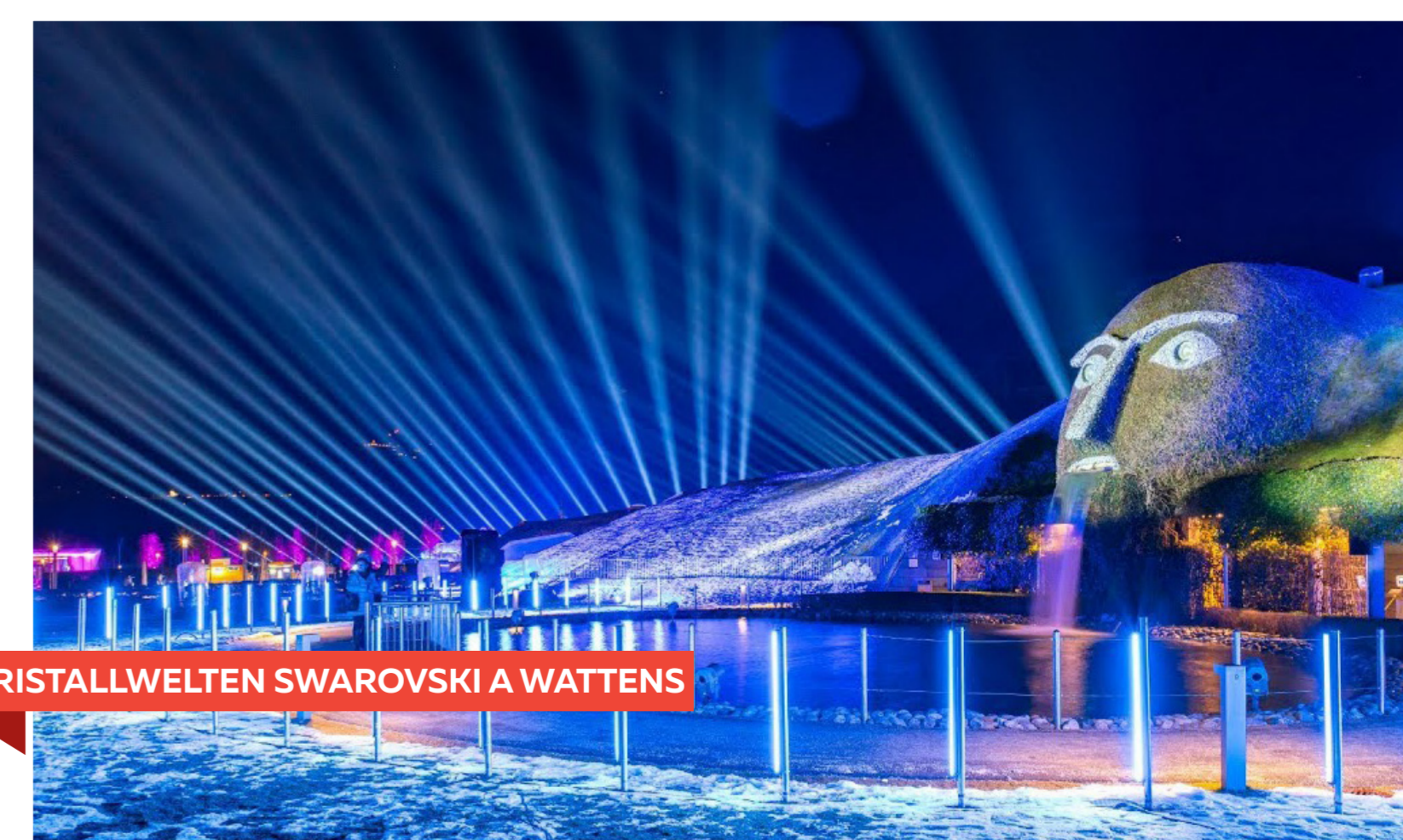
KRISTALLWELTEN SWAROVSKI A WATTENS

QUOTA DI PARTECIPAZIONE: 250 euro adulti • 100 euro bambini 6/13 anni • gratis 0/5 anni entro sabato 10 novembre versando 100 euro procapite presso l'ufficio ragioneria del Comune.