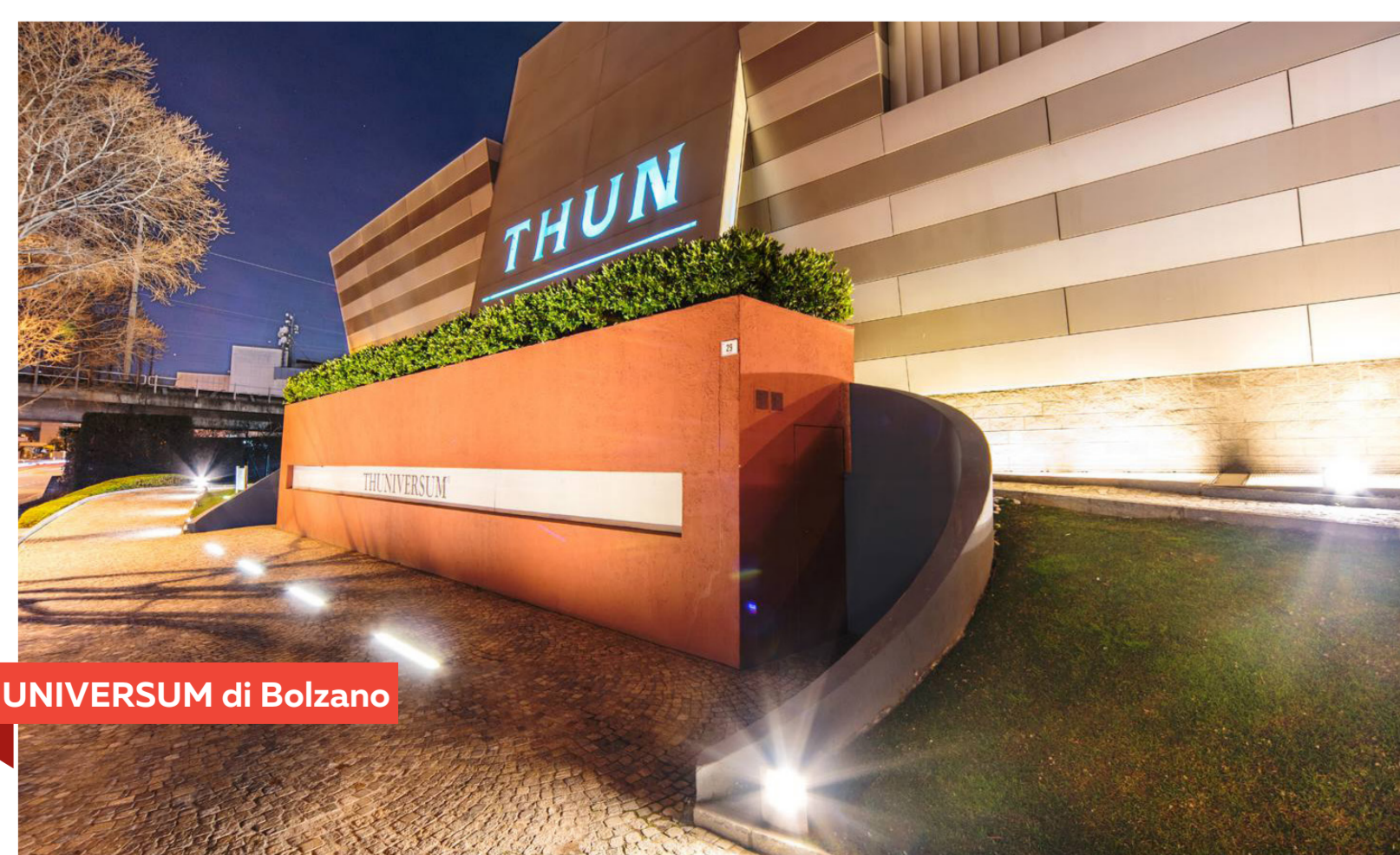
THUNIVERSUM di Bolzano