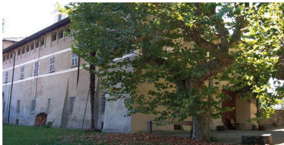
BURIASCO, Il Castelletto