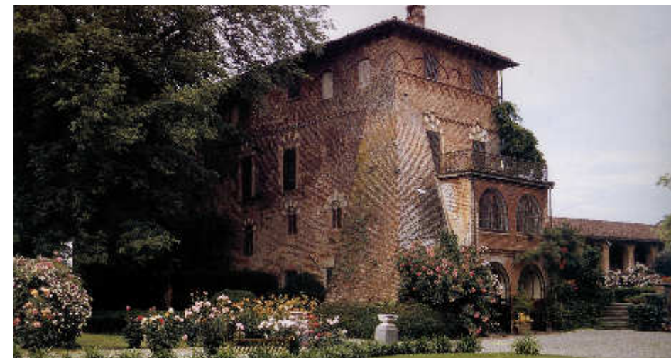
VILLAFRANCA P.TE, Castello di Marchierù