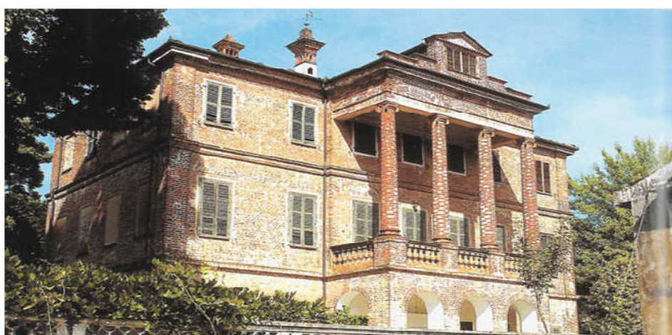
PANCALIERI, Villa Giacosa-Valfrè di Branzo