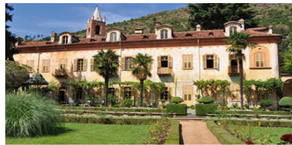
PIOSSASCO, Villa Lajolo

ORARI DI APERTURA: 9.30 - 12.30 E 14.30 - 19.00 GIORNATE DI APERTURA: