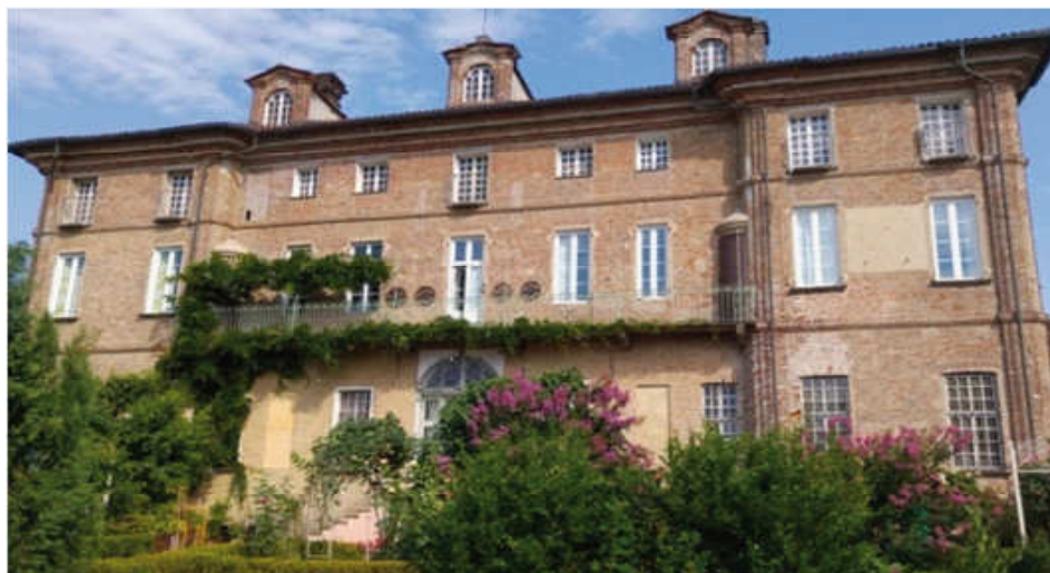
CASTAGNOLE P.TE, Palazzo dei Conti Filippa