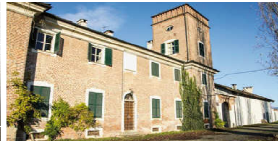
VOLVERA, Palazzotto Juva