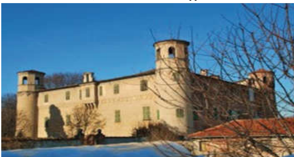
OSASCO, Castello di Osasco