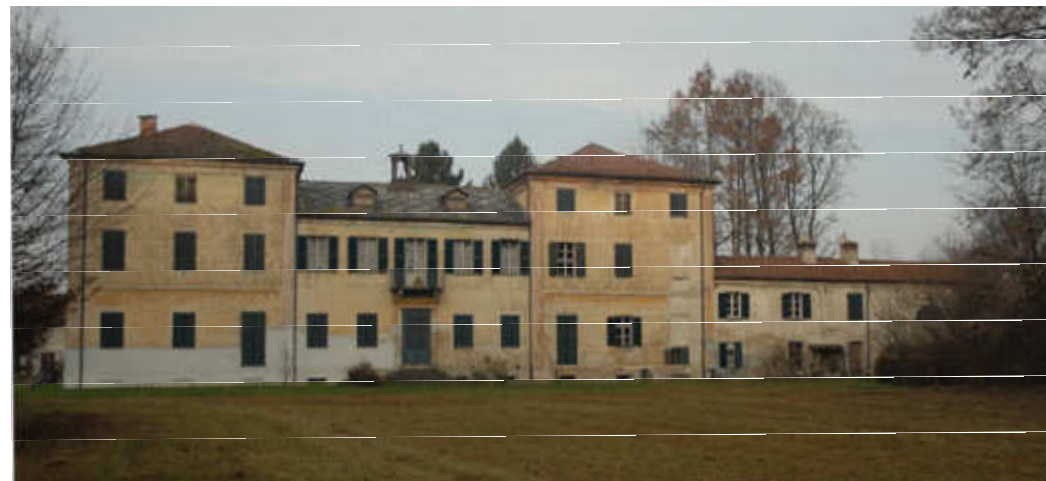
PIOBESI TORINESE, Villa La Paesana