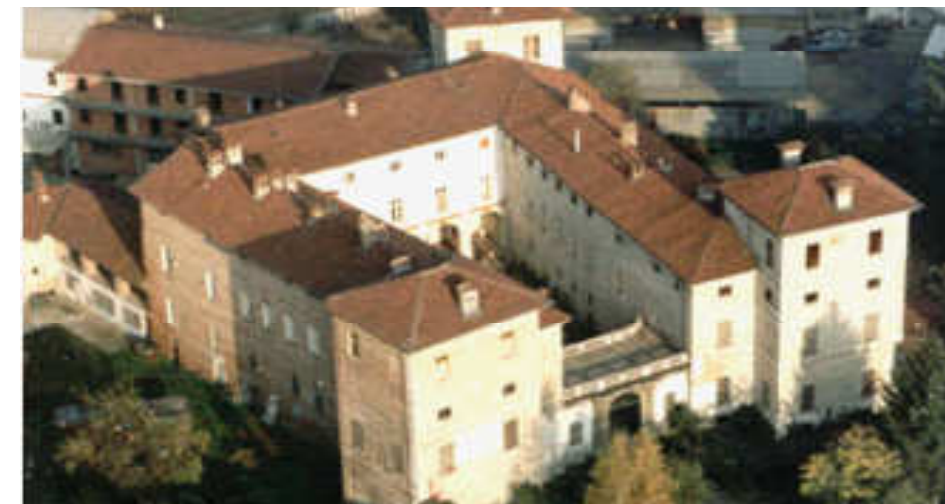
VIRLE P.TE, Castello dei Romagnano